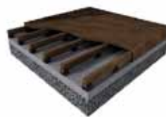
Sistema de montaje