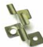
Detalle de anclaje