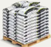
Palet / Palette