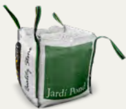
Big Bag 500 / 1000 kg