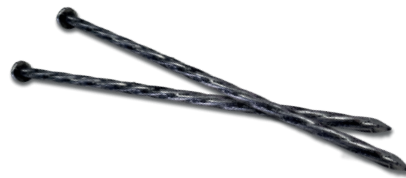
Detalle del anclaje Anchor detail Détail ancrage