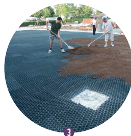
3 Llenado con tierra en caso de plantación con césped o con gravas.