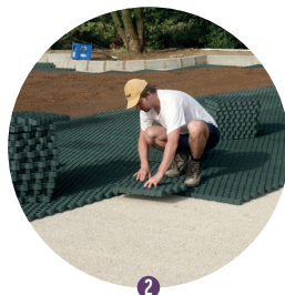
2 Instalación de placas fila por fila.