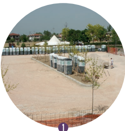
1 Compactar suelo con grava o machaca.