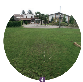
4 Resultado con césped.